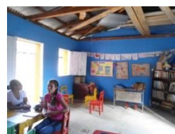
Barrio Mercado Monseñor Madrigal