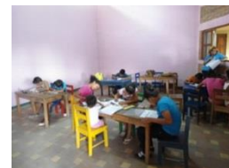
Barrio Nuevo Amanecer