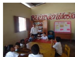
Barrio Roberto Gómez

Per Barrio , s'intendono i quartieri nei quali sono state ubicate le casitas.