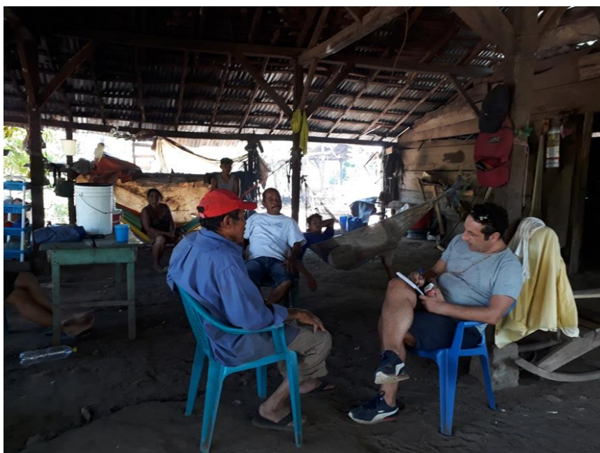
Qui mi trovo in una zona rurale non elettrificata, ricompilando informazioni per dimensionare i pannelli fotovoltaici per questa famiglia contadina.

Come avrete notato sono decisamente ingrassato!!! Però, se avete letto i miei precedenti bollettini già lo sapete che anche io sono un poco "guenguense"!!! Sempre penso: "Se alla fine sequestreranno anche me....almeno che facciamo fatica!!!!".