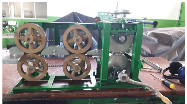
Macchina per il taglio delle caramelle fabbricata nell'Università per l'impresa sociale a Somoto

L'Università, oltre all'appoggio tecnico e tecnologico nella zona di Somoto, inizia a essere conosciuta anche per la costruzione di macchine semi automatiche adatte ai nuovi processi e alla crescita della piccola e media impresa. Inoltre ha sviluppato un software per la gestione delle energie rinnovabili nelle zone rurali non elettrificate. Questo software permette una sostenibilità tecnica dei pannelli fotovoltaici e un controllo remoto dell'efficienza. Infine molto presto attiverà una linea di produzione di olii e un laboratorio di analisi per fornire assistenza alle imprese private nazionali.