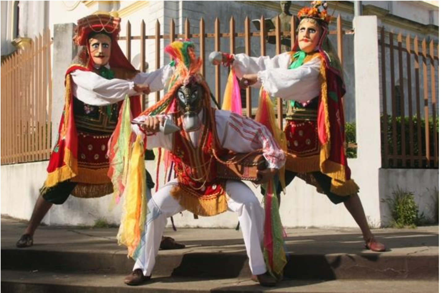
Ballo tradizionale Nicaraguense "El Gueguense"